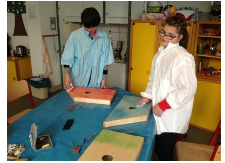
... und mit einem trockenen Tuch einpolieren