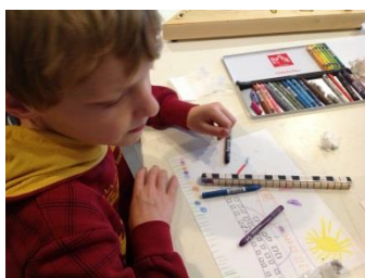
Stege anmalen: schwarze und weiße „Tasten“