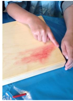
mit den Fingern verteilen