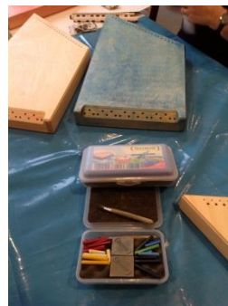
Mit Bienenwachs versiegeln