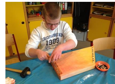
Wirbel einklopfen und mit der Stimmkrücke eindrehen