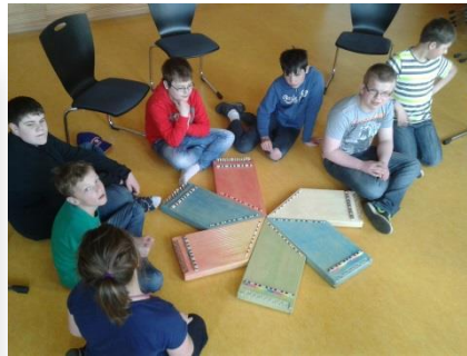
Einzigartige Instrumente sind entstanden, auf die die Schüler und Lehrer wirklich stolz sein können