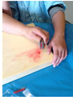
Farbpigmente reiben ...