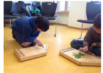
Die zarten Töne der Zauberharfen laden ein zum experimentellen Erkunden von musikalischen Parametern und ermöglichen spannendes und entspannendes Musizieren.