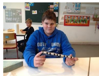
... und seitlich die Töne in Boomwhacker-Farben