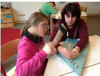
Stöcke mit dem Gummihammer einklopfen